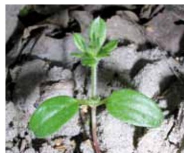
ISOFOX – auch gegen Klette bis max. 2. Quirl